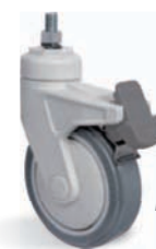
FP - Freio Pedal